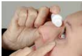
Druppeltechniek 1 zijaanzicht