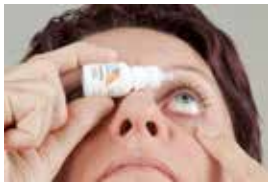
Druppeltechniek 1 zelf druppelen

U druppelt de eerste 2 weken na de operatie 4 keer per dag, namelijk om 8:00 uur, 12:00 uur, 18:00 uur en om 22:00 uur. Daarna gaat u de druppels per week afbouwen volgens het schema op het recept. Alleen als de oogarts iets anders met u heeft afgesproken, volgt u een ander schema. Op de foto's hieronder kunt u goed zien hoe u uw oog moet druppelen.