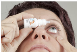
Druppeltechniek 1 zelf druppelen

Op de foto's kunt u goed zien hoe u uw oog moet druppelen.