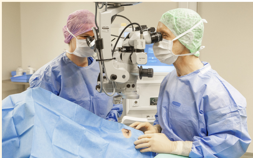
Tijdens de operatie

U ligt tijdens de operatie ongeveer 30 minuten op een stoel. Uw gezicht wordt afgedekt met een doek, waaronder extra frisse lucht stroomt. Tijdens de operatie wordt het oog opengehouden met een oogglidspreider. De oogartsen van Noordwest Ziekenhuisgroep passen de modernste operatietechnieken toe, namelijk phaco-emulsificatie met een opvouwbare kunstlens. Het kan zijn dat de oogarts tijdens de operatie een reden heeft om de techniek wat aan te passen. De oogarts vertelt u dan waarom dat nodig is en wat er gebeurt.