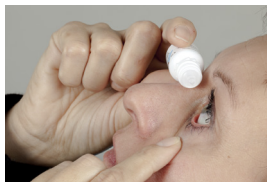
Druppeltechniek 1 zijaanzicht