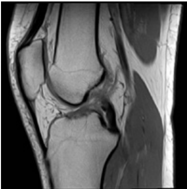
MRI: voorste kruisband intact

Tijdens het sporten of het maken van een verkeerde draaibeweging kan de voorste kruisband scheuren. U zakt door uw knie of verdraait uw knie. Vaak ervaart u een knappend gevoel in de knie. Zwelt u knie direct erna erg op? Dan is er een kans dat uw voorste kruisband voor een deel of volledig gescheurd is. De klachten verschillen: vrijwel geen klachten, een instabiel gevoel of door uw knie zakken. Pijn heeft vaak een andere oorzaak dan een gedeeltelijk of volledig gescheurde voorste kruisband. Meestal is een ander letsel de veroorzaker van pijn, zoals kraakbeenschade, een gescheurde meniscus of een botkneuzing. Om er zeker van te zijn dat uw voorste kruisband gescheurd is, gaat de orthopedisch chirurg uw klachten na, ook krijgt u een lichamelijk onderzoek van de knie, een röntgenfoto en eventueel een MRI-scan. Soms is een kijkoperatie nodig om de diagnose te bevestigen.