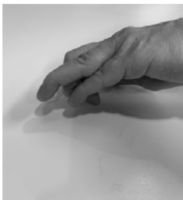
Gebogen stand vingertop (malletvinger)

Een malletvinger is een aandoening van een deel van de strekpees van de vinger. Hierbij gaat het topje van uw vinger hangen, zoals in onderstaande afbeelding. U kunt door de aandoening de top van uw vinger niet meer strekken.