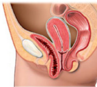
Verzakking van de voorwand van de vagina

Bij een verzakte voorwand is de voorkant van de vagina naar beneden gezakt in het bekken. Omdat de blaas op een deel van de voorwand ligt, is de blaas ook verzakt. Bij een verzakte achterwand is de achterkant van de vagina naar beneden gezakt in het bekken. Omdat de endeldarm op een deel van de achterwand ligt, is de endeldarm ook verzakt.