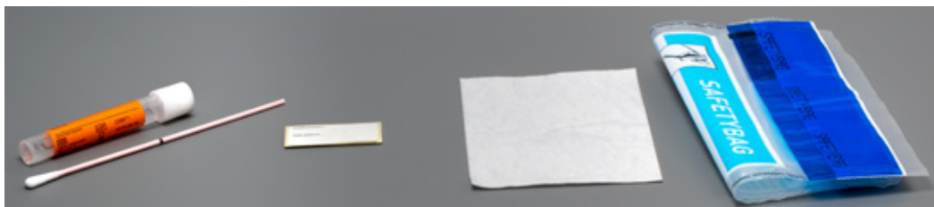
buisje en wattenstaafje