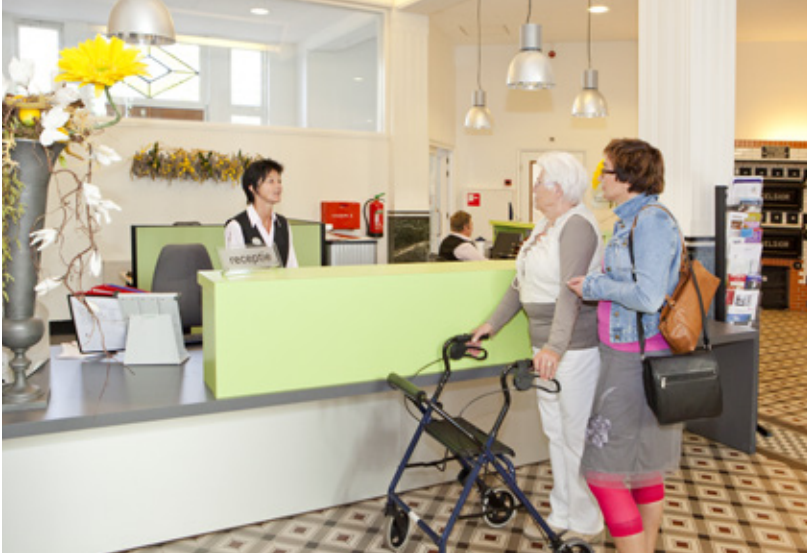
Aankomst receptie bij een revalidatiecentrum