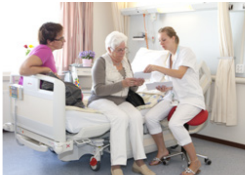
De verpleegkundige geeft u informatie over uw ontslag